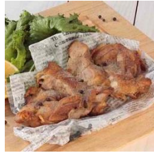
ローストチキンスパイシー ¥800