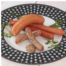
ソーセージ盛合せ ¥900