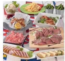
パーティーコースは飲み放題付き 3500円と4000円の2コース