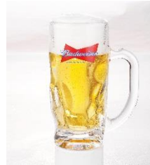
パドワイザービール 中ジョッキ ¥600