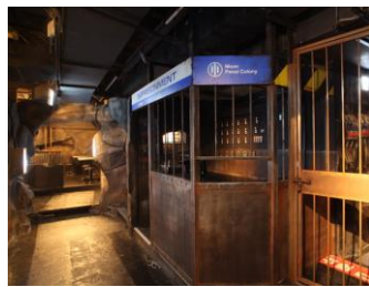
薄暗い地下牢の雰囲気演出