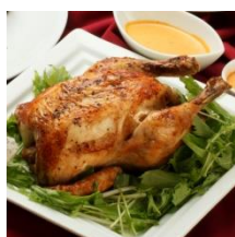
メインディッシュ