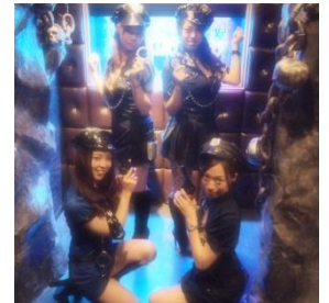
ポリスが席までご案内

そのこだわりは入店時から始まり、光と音の交差する迷路のようなエントランスを抜けた先で、待ち構えていたポリスに手錠を掛けられます。連行されたのは、鉄格子に囲まれた薄暗い監獄個室。この牢獄でお客様には「囚人」として晚餐をして頂きます。灰と黒のボーダーの制服に身を包んだ模範囚（ホールスタッフ）の運んでくるピーカーやフラスコ・メスシリンダーに注がれた毒々しい「オリジナル実験カクテル」や、味でもヴィジュアルでもネーミングでも楽しめる「オリジナル演出料理」、記念日には骸骨や十字架を模したケーキにお名前とメッセージを入れてモンスターがお祝いにお邪魔します。