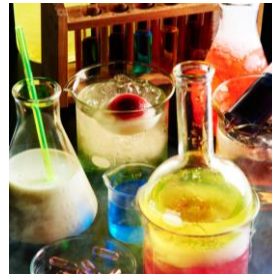
ピーカーやフラスコのカクテル