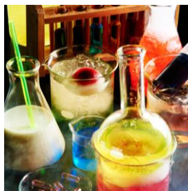
ビーカーやフラスコのカクテル