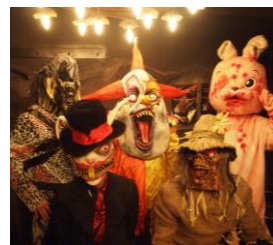
モンスターがサプライズ

そのこだわりは入店時から始まり、光と音の交差する迷路のようなエントランスを抜けた先で、待ち構えていたポリスに手錠を掛けられます。連行されたのは、鉄格子に囲まれた薄暗い監獄個室。この牢獄でお客様には「囚人」として晚餐をして頂きます。灰と黒のボーダーの制服に身を包んだ模範囚（ホールスタッフ）の運んでくるビーカーやフラスコ・メスシリンダーに注がれた毒々しい「オリジナル実験カクテル」や、味でもヴィジュアルでもネーミングでも楽しめる「オリジナル演出料理」、記念日には骸骨や十字架を模したケーキにお名前とメッセージを入れてモンスターがお祝いにお邪魔します。