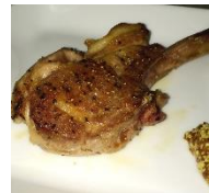
握りこぶしでぶっと飛ばせ アイアンナックル ¥380