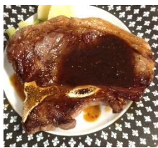
最強人造人間を造る!! パワーフランケン肉 ¥1280