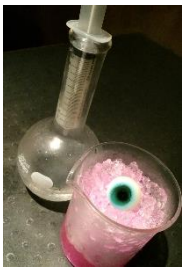
パワー眼力トニック ¥550