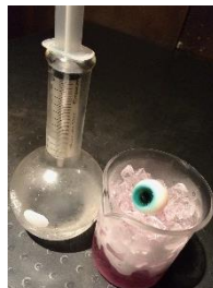
ハイパー眼力トニック ¥550