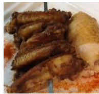
悪魔を串刺し 瞬殺フラン剣 ¥780