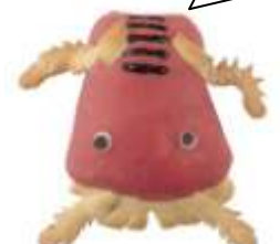
＜アルサスローレン＞ えびパン 216円 /B1F