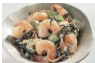
＜おかず本舗 佃浅＞ 小海老とひじきの五目サラダ 100g 367円/B1F