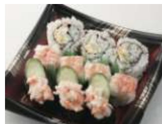
＜古市庵＞ 海老三色 594円 /B1F