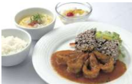
＜お好みダイニング カトレヤ＞ 有頭海老チリセット 1,728円/7F