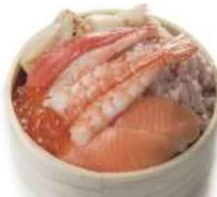
＜札幌かに家＞ 海の宝石箱 1,425円/B1F