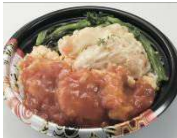
＜聘珍楼＞ 海老チリマヨ丼 680円 ※各日限定20個/B1F