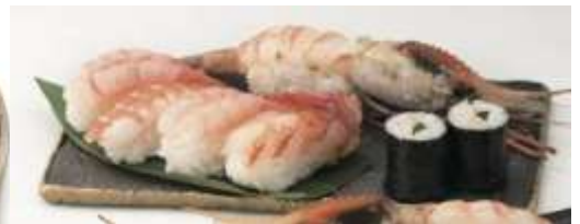
＜北辰鮓＞海老づくし 888円 (握りの一部にご祈願長寿海老を使用) ※各日限定30セット/B1F