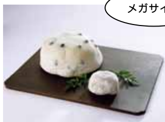
1キログラムの豆大福！通常の 約10倍。各日限定5個 岡埜 栄泉総本家 1kg豆大福・・・ 1,500円