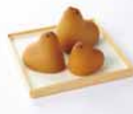
通常サイズの2倍と3倍がセ ットに。東京ひよ子 ひよ子 家族・・・630円