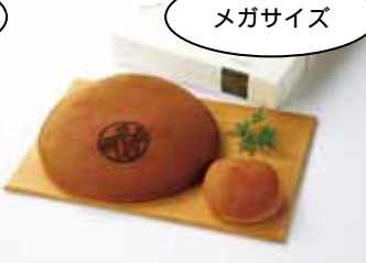
通常サイズの約12倍！老舗和 菓子の挑戦。各日限定10個 森 幸四郎 1kgどらやき・・・ 2,500円