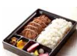
牛たんかねざき 厚切り牛たん ステーキ弁当・・・1,480円

1年間のご愛顧に感謝して、あの人気商品をボリュームアップ！アレンジ！びっくりメガサイズに！