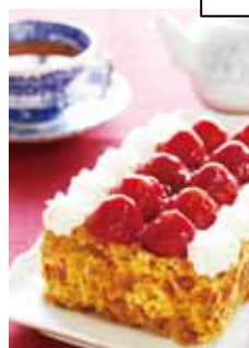
苺が栗に变身！ マキシム・ド・バリ マロンのミルフィーユ・・・3,675円

大人気の生クリームを思い切り味 わえる！「モンシエール シャン ティ」200g・・・1,050円