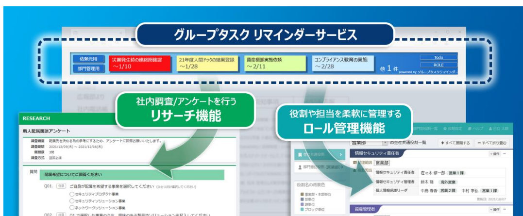
図：グループタスク リマインダーサービスの提供機能イメージ

日立ソリューションズは今後も、GRC業務の効率化を支援し、企業の持続可能な経営に貢献していきます。