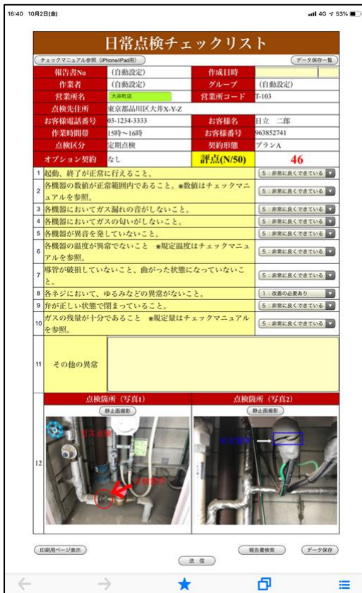
▲快作レポート+アプリ画面