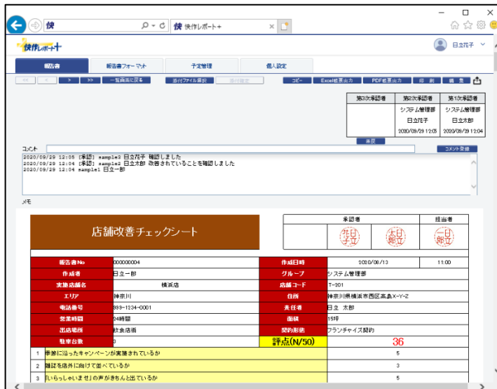
▲報告書閲覧システムの画面