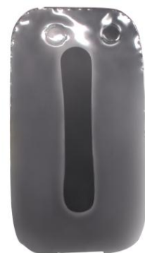
iPhone にぴったりフィットします。操作に違和感がありません。