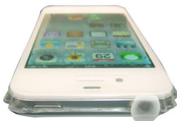
ドックコネクタ・イヤホン防塵・防滴キャップにより、シートを外すことなく充電やイヤホンの装着が可能です。