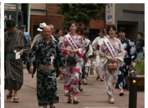
七夕ゆかたまつり (昨年の様子)