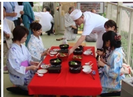
鳥料理 玉ひで (昨年の様子)