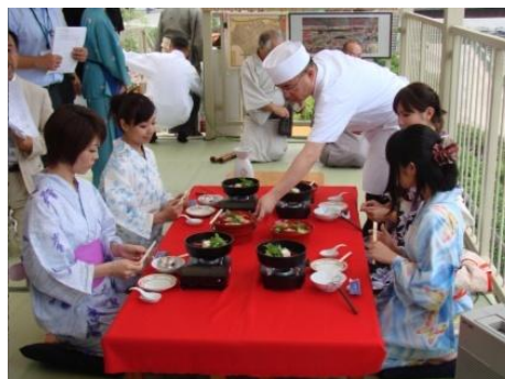
両国広小路棧敷 (昨年の様子)