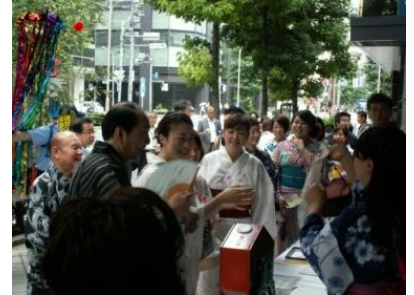
七夕ゆかたまつり (昨年の様子)