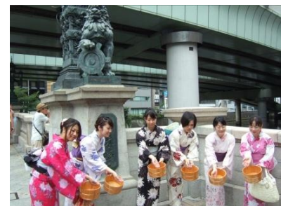
橋の日 打ち水大作戦 （昨年の様子）