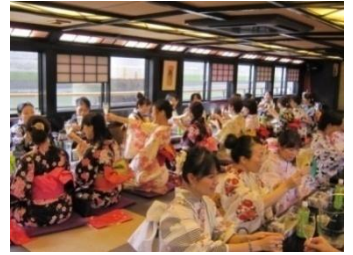
日本橋屋形船 (昨年実施の様子)