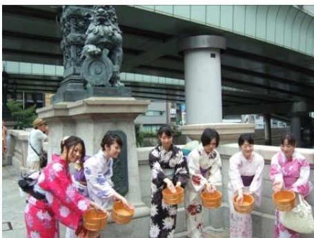
橋の日 打ち水大作戦 (昨年の様子)