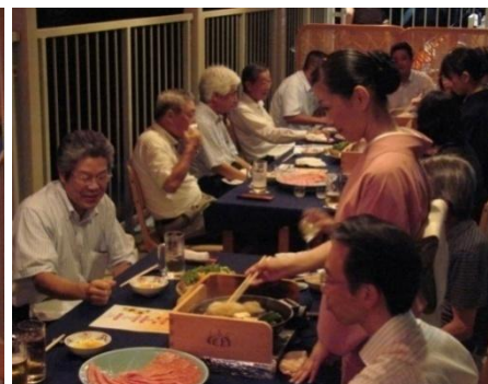
人形町今半 (昨年の様子)

※ECO ED0 日本橋のイベント情報は、まち日本橋 ( http://www.nihonbashi-tokyo.jp/ ) にて都度、最新情報をお届けします。