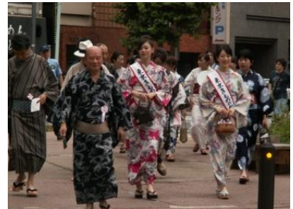
ゆかたで歩こう 日本橋 (昨年の様子)