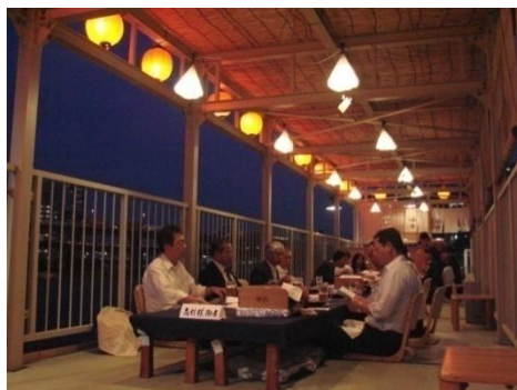
貸棧敷 (昨年の様子)