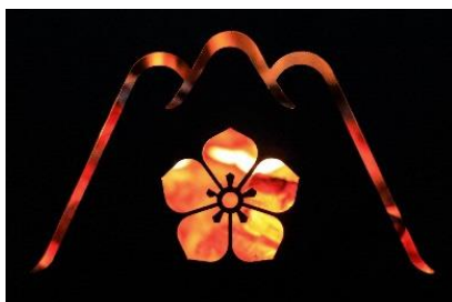
光秀マインドを表現した、オリジナルデザインの焚き火台の風防

SomAbitoのキャンプギアは、 各ふるさと納税サイトで、9月27日(火)より受付を開始 します。