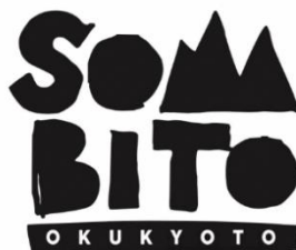
ソマビトのロゴマーク