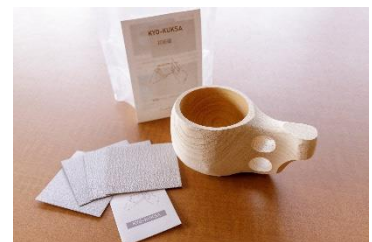
KYO-KUKSA DIY KIT。サンドペーパーも付属している。

SomAbito の人気ギア「KYO-KUKSA DIY KIT」も同時にふるさと納税返礼品に登場します。「KYO-KUKSA」は奥京都の山々が育てた丹州ヒノキの端材を使ったマグカップ。サンドペーパーで自分の手になじむよう削り、作り上げることで、世界で一つだけのオリジナルマグを作ることができます。あえて完成品でなく、自分の手で仕上げられるキットとして販売されています。