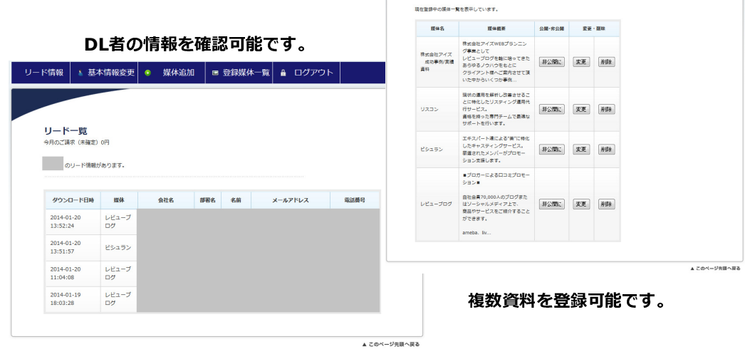
図2：管理画面イメージ