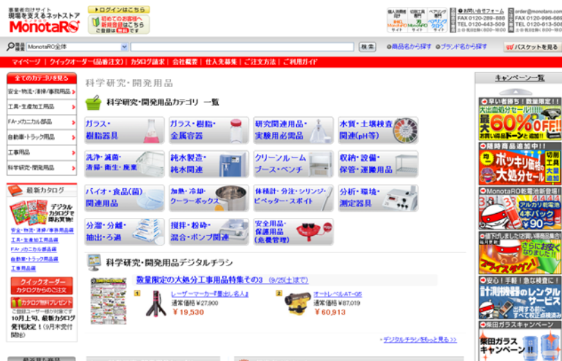
「科学研究・開発用品」専用モール トップ画面イメージ

【Monotaro「科学研究・開発用品」専用モール】 URL: http://www.monotaro.com/labo/ ※10/1(金)よりサービス開始