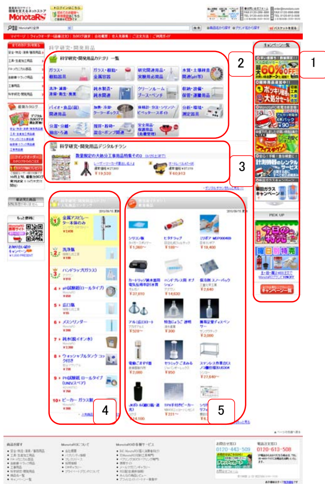
「科学研究・開発用品」専用モール トップ画面イメージ