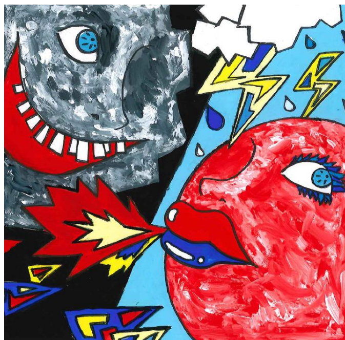
優秀賞 「Cloud, Sun, and You」