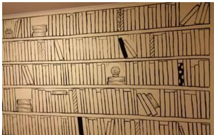
ショールームに施工された壁面