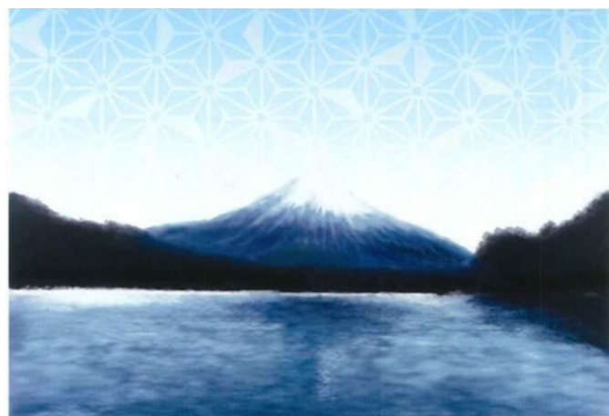
ご提出いただいたデザイン