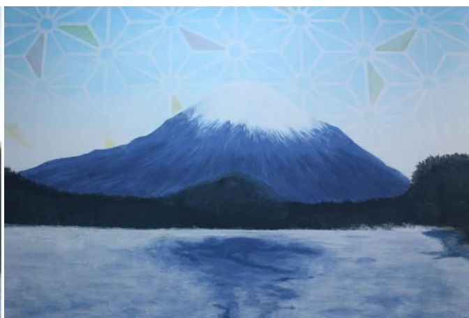
ショールームに施工された壁面