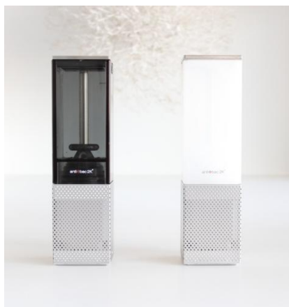
ブラック(左)/ホワイト(右)

尚、このビタミンシャワー ソリューション300%は、ビタミンシャワー2でのみ、放出が可能です。