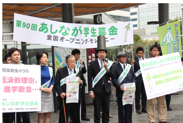
17日に東京・有楽町で実施したオープニングセレモニー

あしなが学生募金事務局は、病気・災害・自死で親を亡くした子どもや、親が重度の障害を持つ子ども奨学金を募る「第90回あしなが学生募金」を、全国の主要駅頭・街頭など約200拠点で実施いたします。遺児家庭や障がい者家庭の窮状を、より広く社会に訴え、支援の輪をさらに大きく広げていくためには、報道機関の皆様のお力が必要です。どうかご取材・ご報道くださいますようお願い申し上げます。