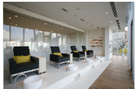
※写真は 東京ミッドタウン店 ネイルブース

uka 東京ミッドタウン店 〒107-0052 東京都港区赤坂9-7-4 東京ミッドタウンガレリア2F 電話 03-5413-7236 営業時間 11:00~23:00 定休日 元旦のみ URL www.uka.co.jp