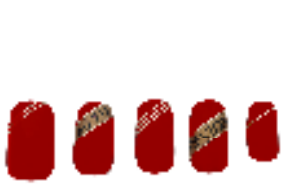
スポーティ グラマラス