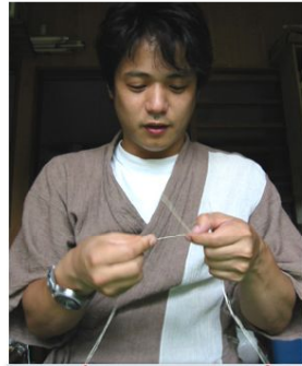
絹文の古から伝わる原始布・藤布（ふじふ）昔ながらの技法で藤糸と絹糸との融合による現代的な帯を織っています。遊絲舎