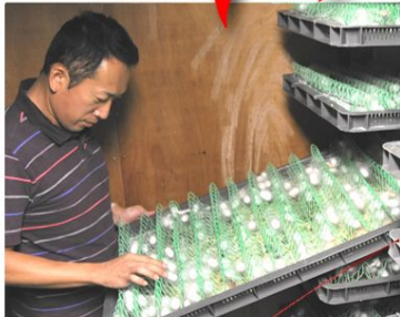
金銀糸や糸色を使って「縫取りちりめん」を織る傍ら、自分で蚕を育て、こだわりの商品を創作しております。柴田織物