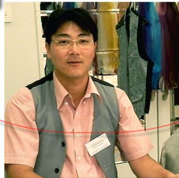
シルクって本当に不思議な糸だなあ。織物って本当に奥深いなあと思う。その不思議さと奥深さを皆様と共有できたらと心から思う。丸幸織物