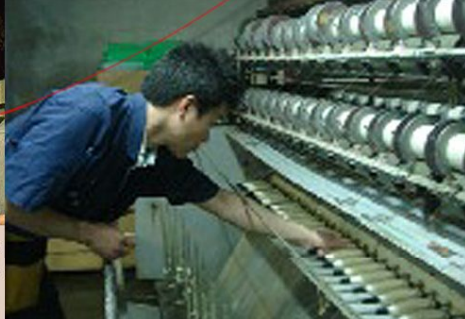
我社では300年前より丹後に伝わる縮緬の技法「水撚り八丁撚糸」その撚糸を駆使したさまざまな「シボ」の丹後ちりめんを織っています。田勇機業