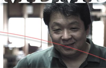
丹後の自然の中で、手染めのあじわいや陽の光による色合いや移ろいを暈し染で表現し、色の優しさやグラデーションを追求しています。小林染工房