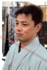
帯を中心に波織り等、自分の性格に合わせて作った織物を作っています。養父織物