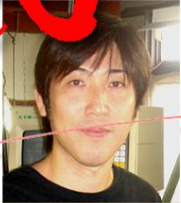
撚糸 デザイン 製織の一貫生産 120台の織機を揃え、紋織の事ならお任せ下さい。江原産業