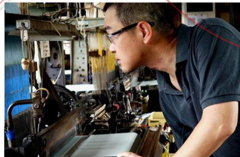
丹後ちりめんを織り続けて78年。現在3代目が織物の奥深さ面白さを感じ、ちりめんの技術を活かしたストールにも取り組んでいます。丸栄織物