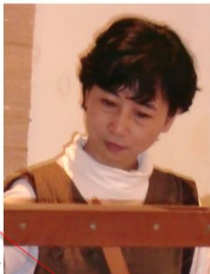
山野の草木で染めたり織ったり。緑あふれる丹後の山から愛と平和を発信します。山象舎