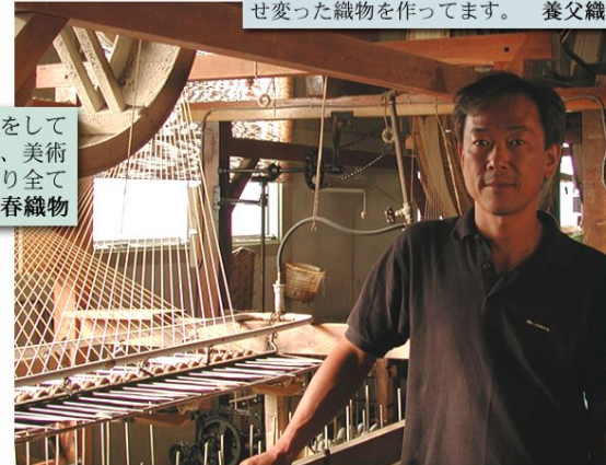
創業180年の我社は昔ながらの機械を使い、よこ糸にどこよりも強い撚りをかけ、コシがあって且つ柔らかい独特の風合いをもつ縮緬を製造しております。山藤