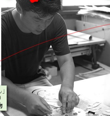
海の煌めきを、貝の光を織っています。七色に煌めく貝殻には海の底まで届く光が閉じ込められています。民谷織物