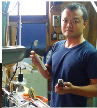
機屋を継ごうと決心して早6年。見た目のわりには未熟者ですが丹後ちりめんを受け継ぎ、守り続けたい気持ちは熟しています。丹後に乞う御期待。安田織物