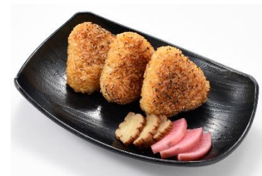
香ばし！焼きおにぎり(3個) 700 円