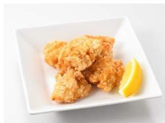
若鶏塩麴揚げ 650 円