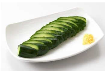
きゅうり一本漬け 450 円

お仕事帰りや休憩に「1杯だけ飲みたい」という方にもおすすめのお気軽おつまみメニューも。