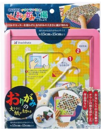
大人向けパッケージ