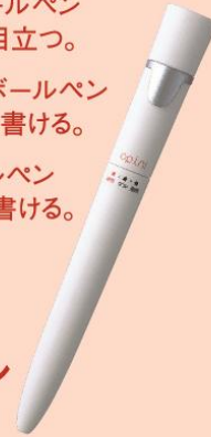
オピニ 使い分けボールペン ¥500+消費税