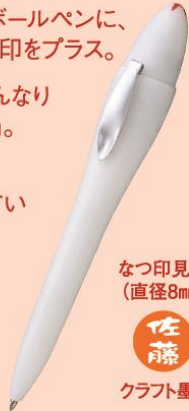
オピニ ネームペン ¥1,800+消費税