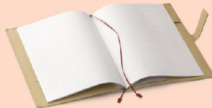
オピニ おめかしノートカバー A5 ¥1,300+消費税 B5 ¥1,500+消費税

..... <商品に関するお問い合わせ> シヤチハタお客様相談室 TEL : 052-523-6935