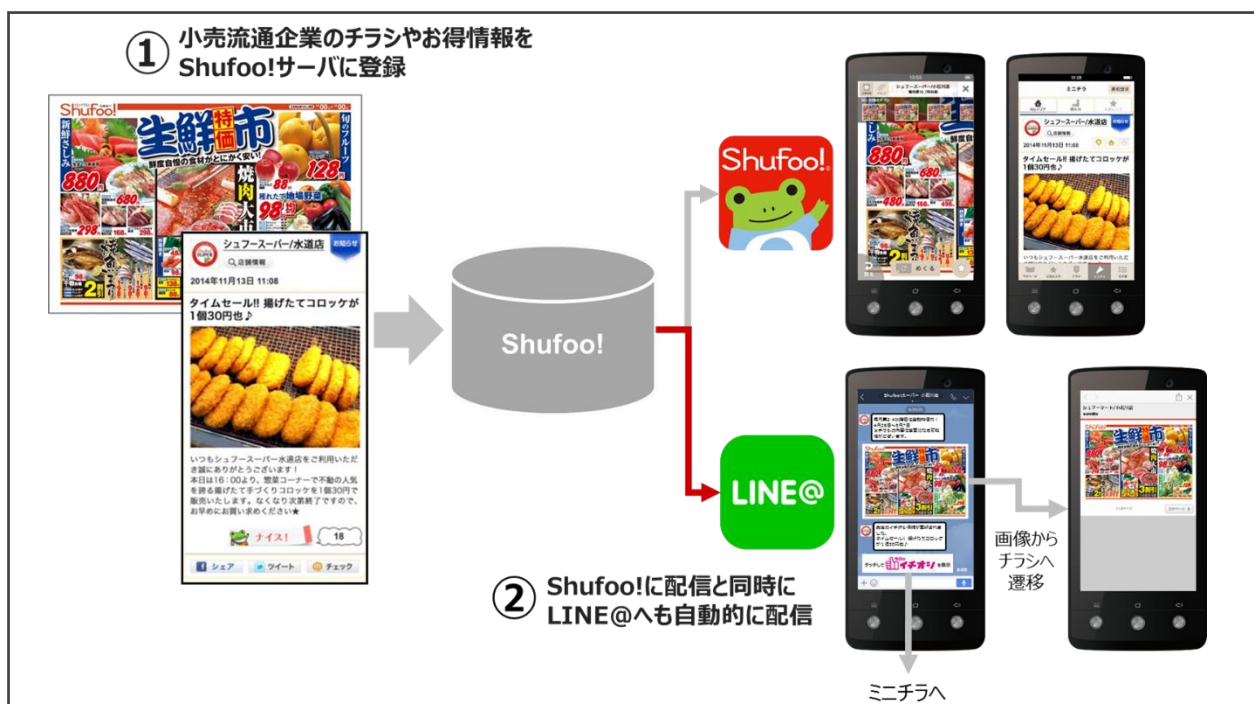
LINE@との連携による情報配信の仕組み

凸版印刷株式会社(本社:東京都千代田区、代表取締役社長:金子眞吾、以下 凸版印刷)は、国内最大級の電子チラシサービス「Shufoo!(シュフー)」(※1)において、LINE 株式会社(本社:東京都渋谷区、代表取締役社長:出澤 剛、以下 LINE)とSMEパートナー(※2)として業務提携。LINEが運営するコミュニケーションアプリ「LINE」(※3)のユーザーへ情報配信ができるサービス「LINE@」(※4)と連携し、小売流通企業のチラシをはじめとした買い物情報を「LINE@」でも配信可能としました。