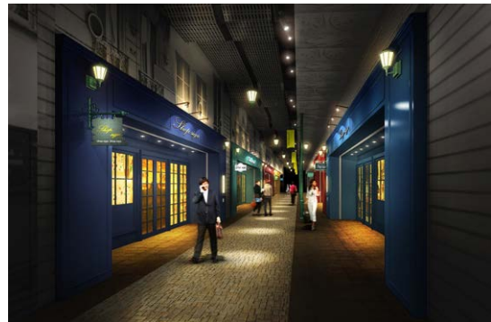
【カルチェラタンをイメージした東西通路】