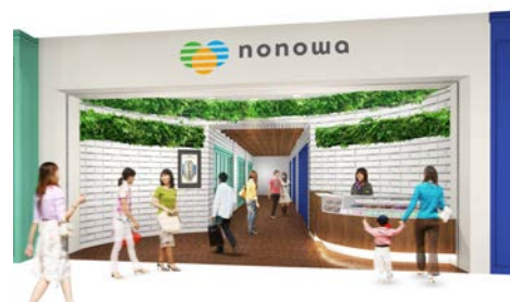
【nonowa 東小金井コンシェルジュ（イメージ）】