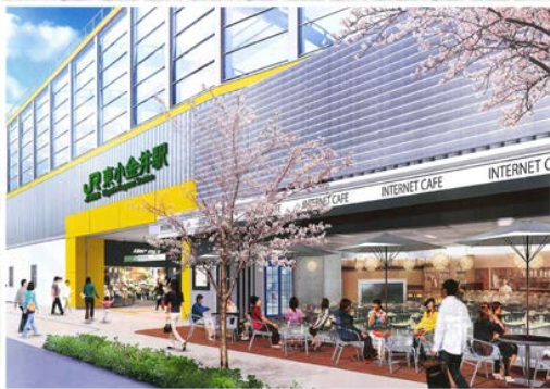
【駅南側からの外観】