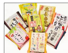
かりんとうシリーズ