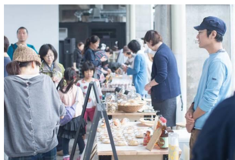
マーケットイメージ