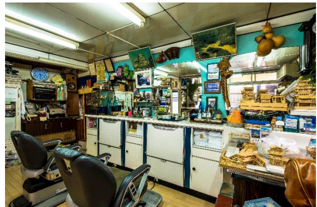
『トコヤ・ロード』より