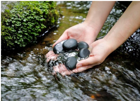
敷地内の天神川で清められた玄武岩

季節の変わり目、夏の疲れを癒し寒い冬を乗り越えるため、この秋は「安眠」をテーマに、北山杉やヒノキのアロマとホットストーンを組み合わせ頭部や首の凝りを解きほぐす「ホットストーン ヘッドヒーリング」を販売いたします。天然温泉の足浴に始まり、安眠効果が高いとされる京都産北山杉やヒノキの精油をブレンドしたアロマで呼吸を整えた後、ホテルの敷地内を流れる清流「天神川」で清めた玄武岩をおよそ 60°C に温め、額から頭皮、首、肩、そしてデコルテを順に優しくマッサージしていきます。程よい温かさのホットストーンを用いて血流やリンパの流れを整え、筋肉の緊張や凝りをほぐし、自律神経の中枢に働きかけることで、心身ともによりリラックスした状態へと導き、高い安眠効果が期待できます。トリートメント終了後は、客室やご自宅でも癒しを感じていただきたいという思いから、お土産として北山杉アロマコースターをお持ち帰りいただきます。心身の健康を保つためのカギとなる“睡眠”を今一度見つめ直し、睡眠習慣をリセットするきっかけに THE ROKU SPA のヘッドトリートメントをご利用ください。