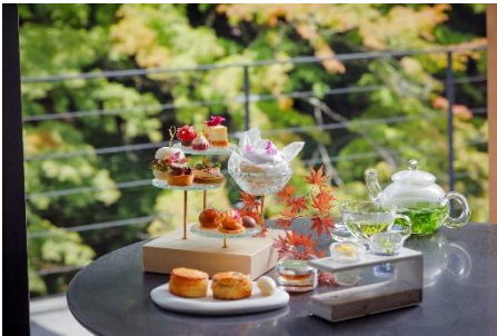
アフタヌーンティー -kitayama sugi-

秋の「収穫」をテーマにしたアフタヌーンティーの提供 安眠へと誘うホットストーンヘッドトリートメントの販売 旅の思い出を「京色パステル」で描く芸術の秋にちなんだ宿泊プランの販売