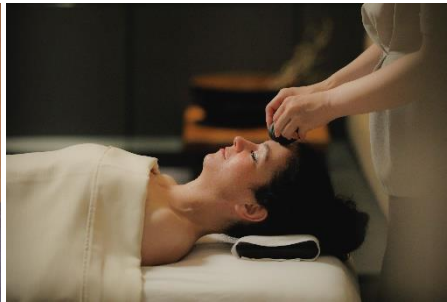
ホットストーン ヘッドヒーリング