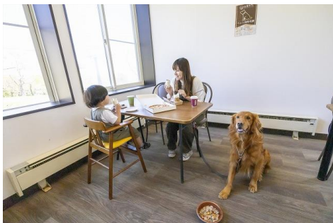
レストラン内に愛犬と一緒に お食事が出来るスペース有り