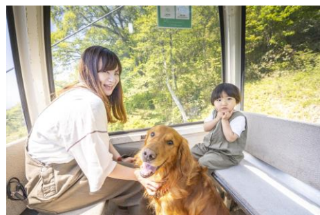
ペット同伴OKのゴンドラ