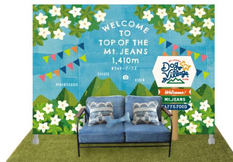
店内フォトスポット(イメージ)