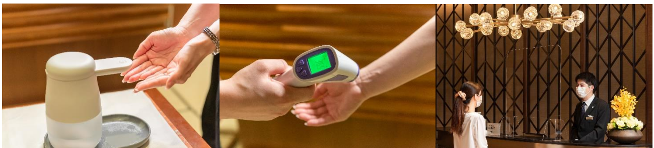
入店時の消毒・検温・接触・飛沫感染予防に関する対策