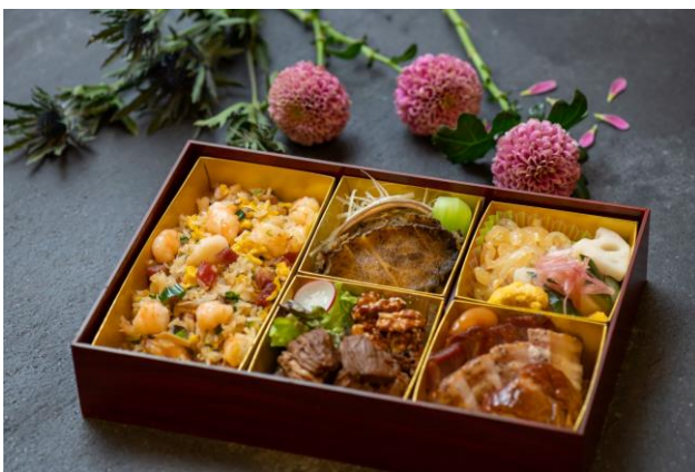
ルームサービスでお届けする「彩龍」料理長特製中華弁当