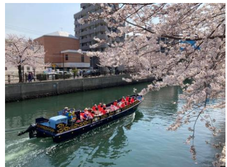
「ベネチア号」で大岡川クルーズ

※ベネチア号：大岡川の横浜日ノ出棧橋をホームポートとした小型のクルーズ船。 横浜の運河や河川、港を巡りながら横浜の歴史や都市構造、風景、水上空間を楽しむことができる。 イタリアの gondola の雰囲気を横浜で味わえるよう「ベネチア号」と名付けられた。