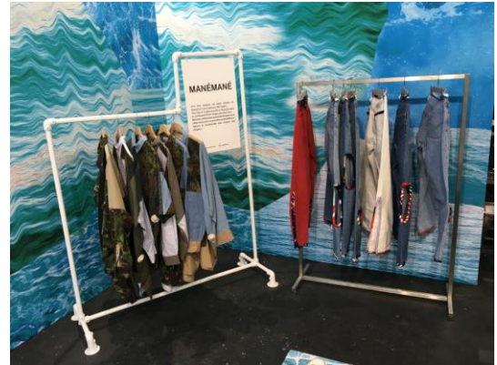
パリ市内のショップ「KILIWATCH」で10月2日まで開催中