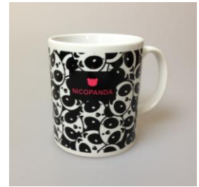
プレート・マグカップ 各 ¥1,890