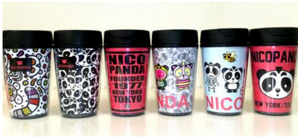
タンブラー 各 ¥1,365