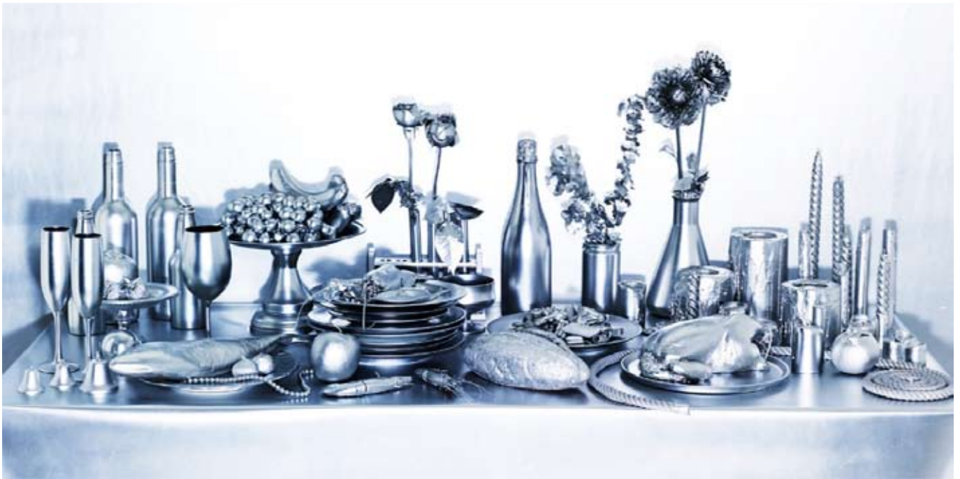
※「場と間 vol.06 BAtoMA CHRISTMAS」メインビジュアル

昨年初開催し「一足も二足も早いクリスマス体験！」と各メディアで話題となった、日本で唯一のクリスマス合同展示会「BAtoMA CHRISTMAS (場と間クリスマス)」が帰ってきます！2014年5月21日(水)～25日(日)の期間中ラフォーレミュージアム原宿にて開催。クリエイターによるインスタレーションやデコレーション提案など、ここでしか出逢えないクリスマスを体験しませんか？展示会エリアでは、バイヤー気分ギフトやオーナメントなどクリスマスにぴったりのアイテムをチェックし、その場でショッピングも楽しめます。「BAtoMA CHRISTMAS」で、半年後のクリスマスをもっと楽しむためのヒントを探しましょう！