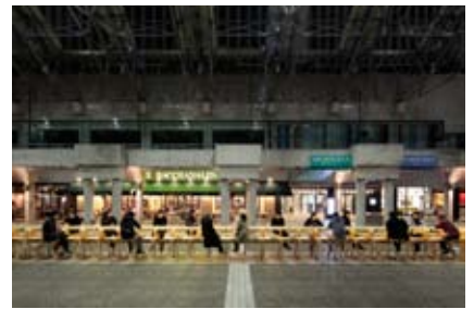
ARKHILLS JOYFUL (2013)