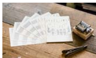
杉山 三 / Sugiyama San

trois/OTOWA 代表。紙巻きオルゴールを『レトロメディア』として捉え、さまざまな活動を展開。大人/子供向けの音づくりのワークショップ多数。漫画オルゴール (mieru record x OTOWA) にて、第 17 回文化庁メディア芸術祭マンガ部門 審査委員会推薦作品に選出。