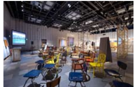
場と間 vol.05 BAtoMA information (2013)

2007年 青参道 立ち上げ、青参道アートフェア プロデュース 2008年 rooms プロダクトエリア 立ち上げ、キュレーション 2009年 roomsLINK ASOBI展 プロデュース 2009年 福岡 DESIGNING 展 プロデュース 2009年 H.P.DECO 福岡店 ディレクション 2010年 場と間 展示会 立ち上げ、vol.01 開催 2010年 株式会社 IMS 「わたしのばしょ」企画コーディネーター 2010年 株式会社パルコ直営ショップ 「once A month」ディレクション 2011年 株式会社パルコ 「PARCO TOURIST」企画コーディネーター 2011年 EXPO TAKA @ Paris ASTIER de VILLATTE ディレクション 2012年 TOKYO10月 H.P.FRANCE プロデュース・運営 2012年 roomsLINK TAIPEI デザインエリア ディレクション 2013年 場と間 展示会 vol.04 「BAtoMA CHRISTMAS」主催 2013年 株式会社 PARCO 「BAtoMA in NAGOYA」企画コーディネーター 2013年 場と間 イベント 「BAtoMA information」主催 2013年 ARKHILLS アーク・カラヤン広場 クリスマス装飾プロデュース