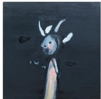
【DOG BITE】 2012年 oil on canvas 60.96cm×182.88cm