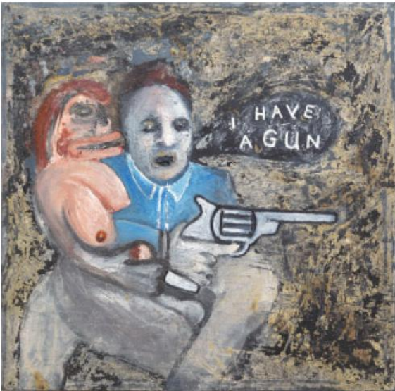
【I HAVE A GUN】 2012年 oil+mixed media on canvas 60.96cm×60.96cm