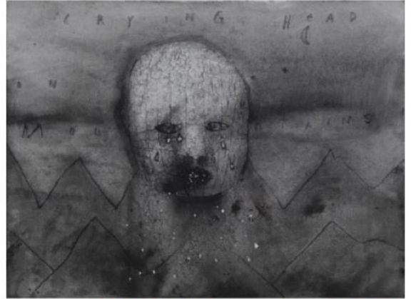
【CRYING HEAD ON MOUNTAINS】 2012年 watercolor on paper 24.13cm×31.75cm