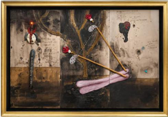
【BOB'S SECOND DREAM】 2011年 mixed media on cardboard 182.88cm×274.32cm