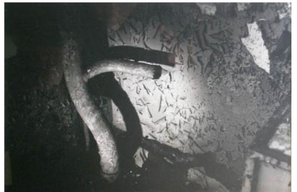
【Untitled (Factory, Poland)】