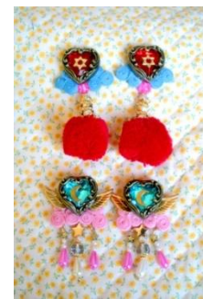
呪い(まじない)イヤリング 上) ¥4,200(税抜)~ 下) ¥4,500(税抜)~