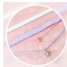
アクセサリ類も充実 各 ¥1,500(税抜)