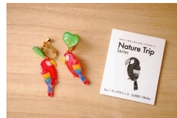
コンゴウインコイヤリング・ピアス ¥6,400~(税抜)