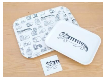
コースター・トレイ 上)スケッチねこたち トレイ M ¥2,500(税抜) 中)スケッチマイキー トレイ S ¥2,000(税抜) 下)スケッチマイキー コースター ¥600(税抜)