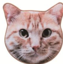
リアルモチーフタオル ¥1,000(税抜)