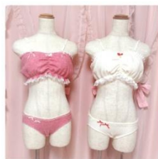
ラフォーレ先行発売の新作 ¥5,800(税抜)