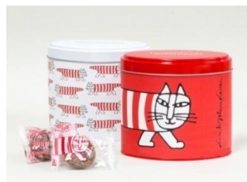
マイキー チョコランチ ¥1,000(税抜)