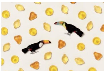
オオハシブローチ ¥7,500(税抜)