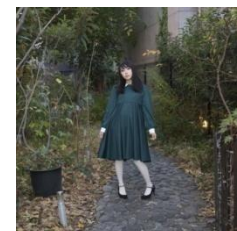
大人気 GOMI HAYAKAWA のワンピースライン ¥23,000(税抜)