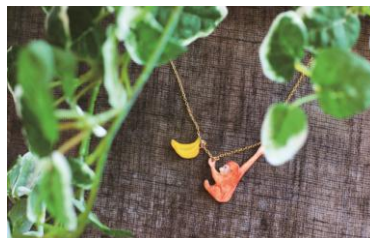
オラウータンネックレス ¥7,600(税抜)