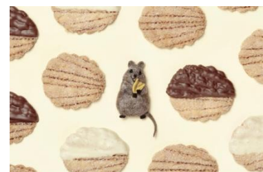
クアッカワラビーブローチ ¥7,000(税抜)