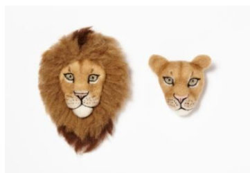
ライオン顔ブローチ ¥6,800(税抜)