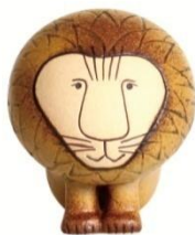
ライオン ミディアム ¥15,500(税抜)