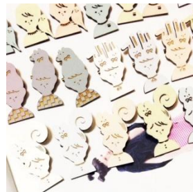
おや？頭に変な気配 プローチ ¥1,500(税抜)