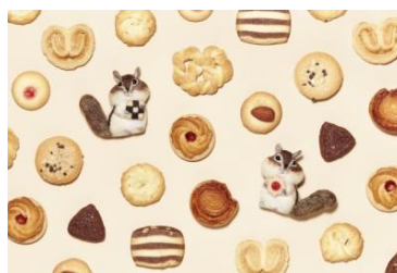
シマリスクッキーブローチ ¥6,800(税抜)