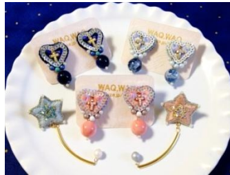
Cross heart イヤリング ¥3,800(税抜) Good night ピアス ¥2,400(税抜)