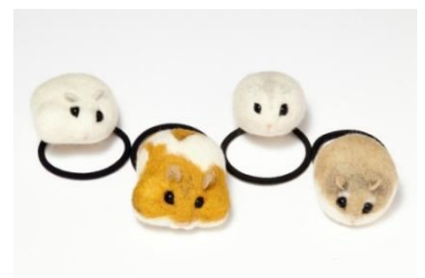
ハムスターヘアゴム ¥3,500(税抜)