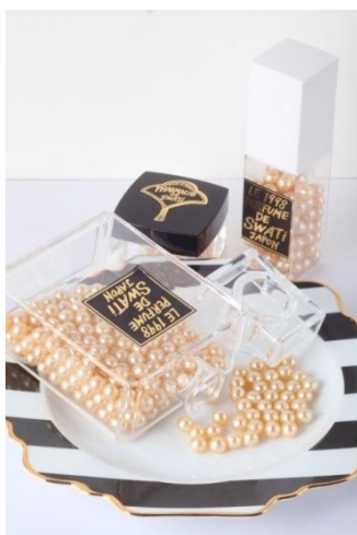
パールをイメージした入浴剤 Bath Pearl ¥5,500～¥2,800(税抜)