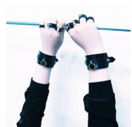
Herz Ring Bracelet ¥4,500(税抜)