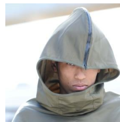
ポンチョ サイダーハウス ¥25,000(税抜)