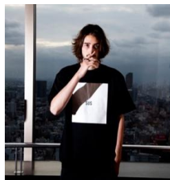
SUS BOX LOGO T-Shirts ¥5,800(税抜)