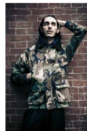
NR.FLAG Remake Jacket "CRUX" ¥28,000(税抜)