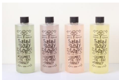
オーガニック素材を使った、野菜のボディーソープ Salada Body Soap 各¥1,900(税抜)