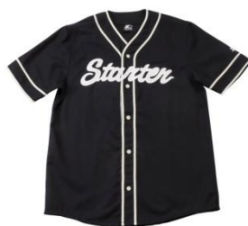
CHAD BASEBALL SHIRT ¥15,000 (税抜)