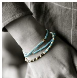
amp japan Vintage White Hearts U.S.A. ¥10,000(税抜)