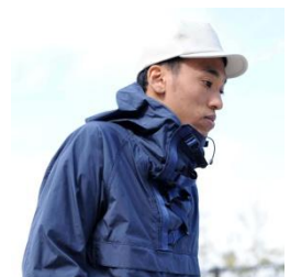
マウンテンパーカ ミーンズワイル ¥56,000(税抜)