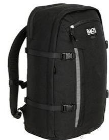
BACH Bike 2B ¥23,000 (税抜)