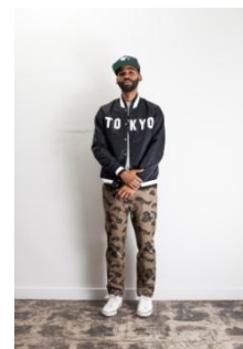
HERMAN NYLON STADIUM JACKET TOKYO ¥25,000 (税抜)