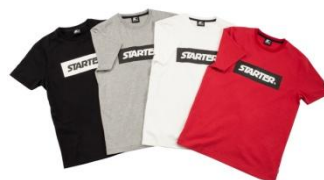
JAKE BOX LOGO T-SHIRT ¥6,000 (税抜)