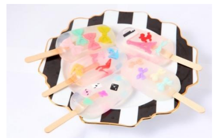
色々なおもちゃパーツが入ったアイス型ソープ ICE SOAP 各¥780(税抜)