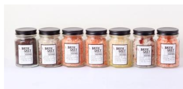
ヒマラヤ岩塩と高品質の天然精油を使った 100%ナチュラル成分のオリジナルバスソルト Bath Salt 各¥1,680(税抜)