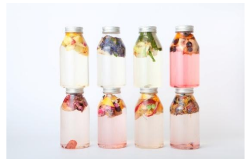
エディブルフラワーとフリーズドライフルーツ&ベジタブルをMIXした食べられるドリンク Flavor Juice 各¥1,500(税抜)