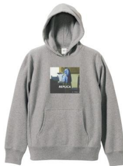
RPLC PARKA ¥13,000 (税抜) ※参考価格