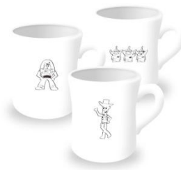
TOY STORY マグ 各1,404円