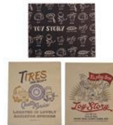
キャンバスアート L 各3,780円