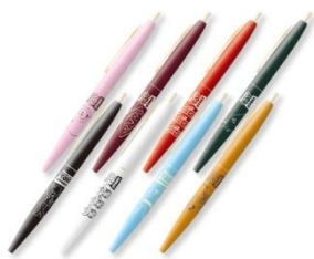
BIC ボールペン 各432円