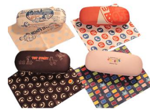
メガネケース 各1,728円