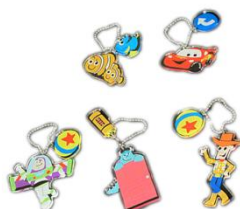
ペアアクリルキーホルダー 各756円