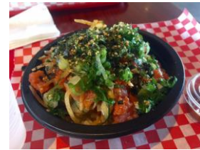
ハワイで料理に使われるふりかけのイメージ