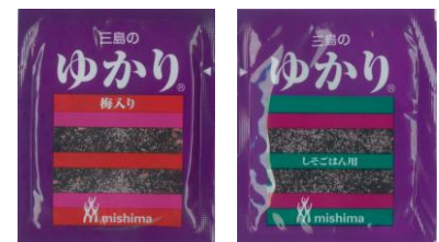
ゆかり®ふりかけセット