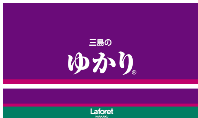
プレゼント外装イメージ

今後もラフォーレ原宿では、インバウンド需要を一過性の現象とすることなく、継続して国内外への発信力強化を狙ってまいります。