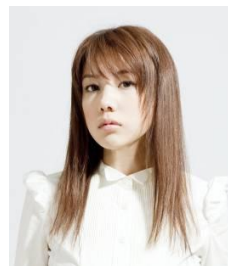
仲里依紗 【Talk・Fashion Show】