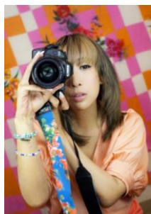
蜷川 実花 【Talk Show】