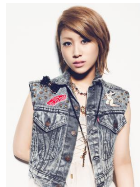
IMALU 【Talk Show・MC】