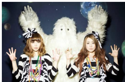
PUFFY 【Talk Show】