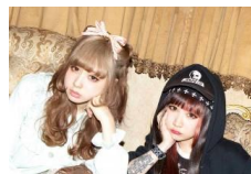
AMOYAMO 【Fashion Show】