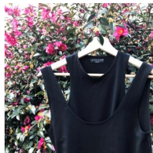
Gabriela タンクトップ 6,000円(税込)