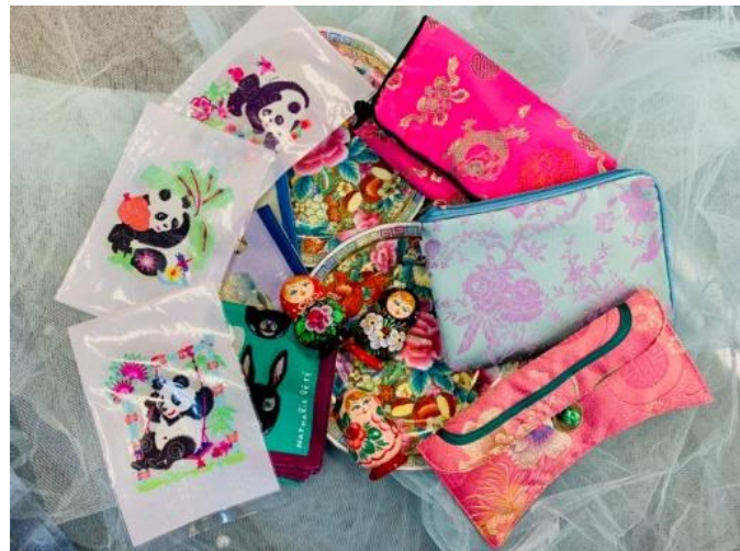
相澤樹セレクト小物 1,000 円(税込)～