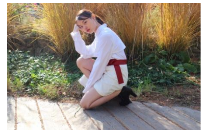
ALAM オールインワン 7,500円(税込)