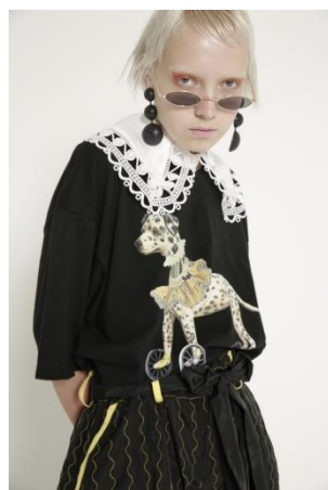
Trinca un plus un