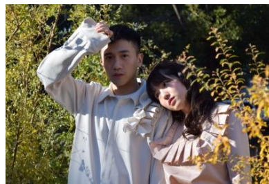
P.M. グレーシャツ 12,000円(税込) フリルブラウス 8,000円(税込)