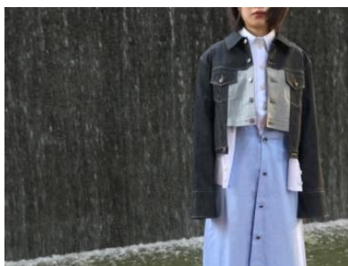
une シャツ 6,800円(税込) デニムジャケット 18,000円(税込) ワンピース 13,000円(税込)