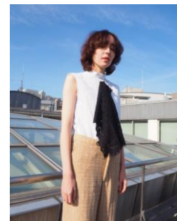
Dear ブラウス 7,400円(税込) ネックレス 2,500円(税込) パンツ 10,000円(税込)