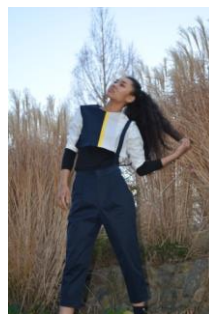
Sauvageonne ブラウス 4,000円(税込) パンツ 7,000円(税込)