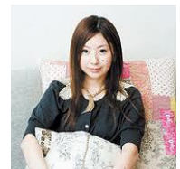
アートディレクター：吉田ユニ