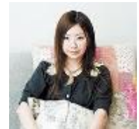
アートディレクター：吉田ユニ