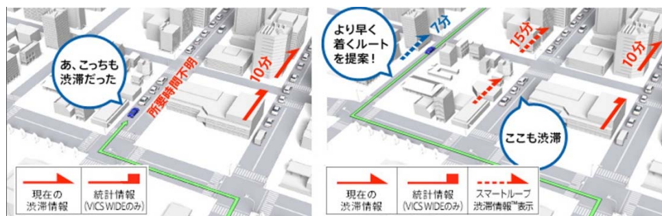
一般的なカーナビの場合 (VICS WIDE/VICS 渋滞情報)

・長年蓄積してきた膨大な渋滞予測データやリアルタイムの走行・交通情報を分析し、ドライバーに最適な情報を提供する「スマートループ渋滞情報™」に対応※2。