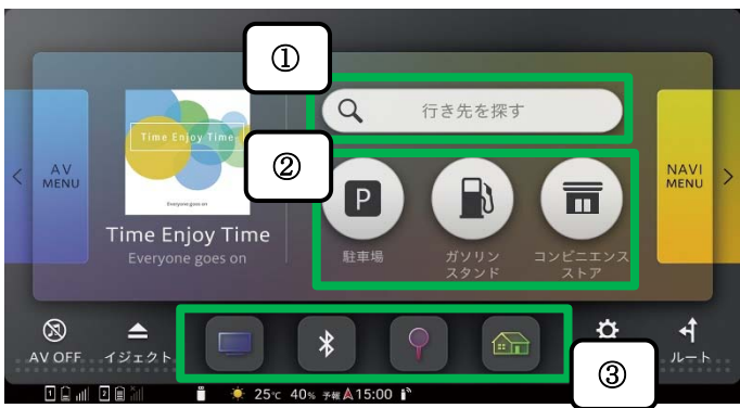
①お出かけ検索 ②ダイレクト周辺検索 ③ショートカットキー

よく利用するカーナビ検索やお好みの AV ソースから 4 つのキーを自由にカスタマイズ可能