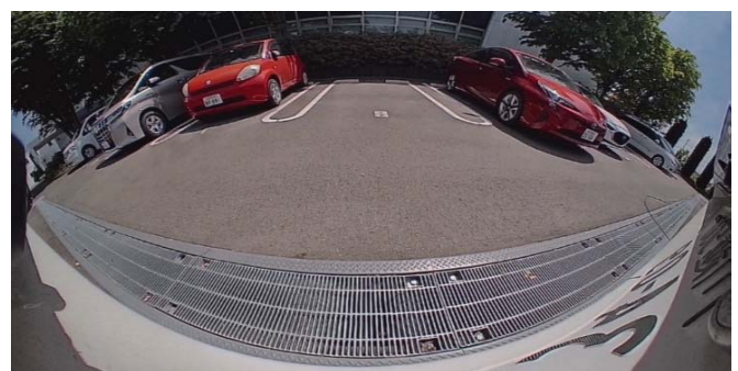
【バックカメラ表示イメージ】