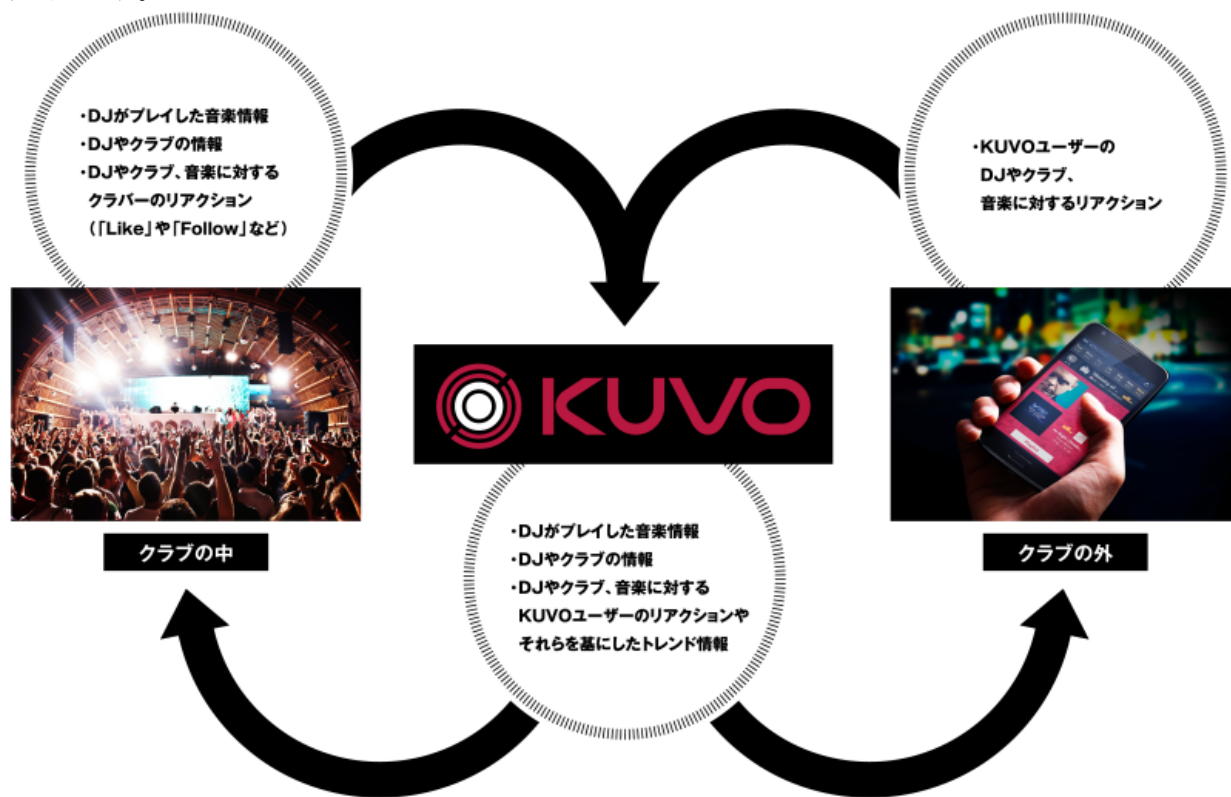
【「KUVO」の提供する世界観のイメージ】

当社のDJ機器が世界中の数多くのクラブ・DJに使用されている強みを活かし、当社製DJ機器と独自のインターネットサーバーをつなぐネットワークを構築しました。「KUVO」の第一弾として、このネットワークを活用し、世界中のクラブバーがスマートフォンやPCを使ってリアルタイムにクラブ情報や最新のトレンドを入手できるサービスを開始します。