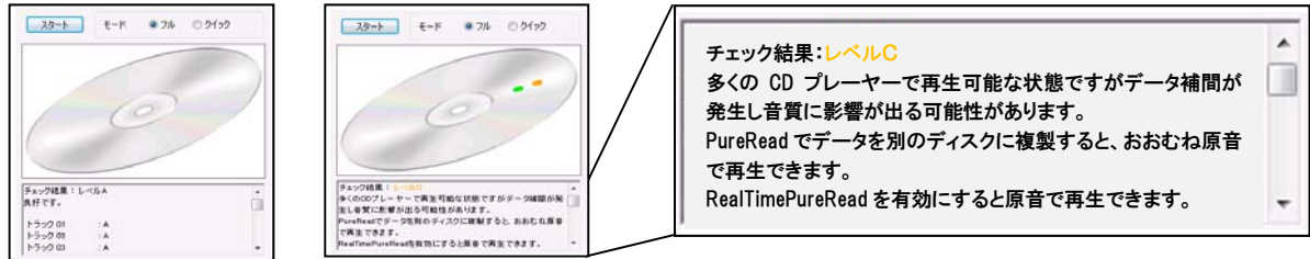
【高い再生品質レベルの表示】

・オーディオ CD の再生品質をチェックして4段階(A～D)で表示するとともに、低い品質レベル(C、D)の場合には、本機の設定変更などの対処方法を表示する「オーディオ CD チェック」機能を搭載しています。本機能は、オーディオ CD のすべてのデータをチェックする“フル設定”と、短時間でデータをチェックする“クイック設定”から選択できます。