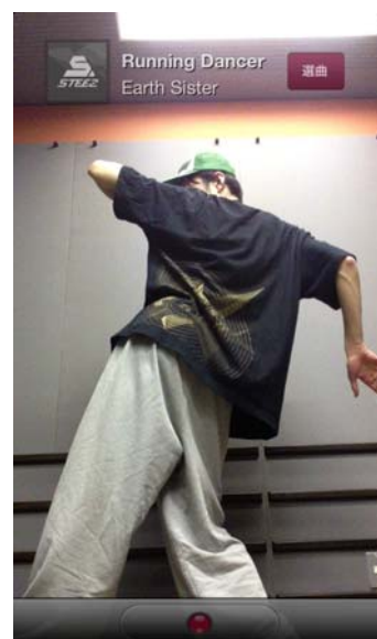
【ビデオレック画面】

本アプリケーションは、楽曲内の指定した部分を繰り返し再生できる「AB リpeat」機能に加え、音程を変えずに再生スピードを調整 ※1 できる「テンポコントロール」機能を搭載しており、iPhone に保存した楽曲を使って効果的にダンスの練習を行えます。また、iPhone のカメラで撮影したダンスの振り付けと、再生した楽曲を重ねて記録できるので、楽曲とのマッチングなど自分のダンスを確認することができます。