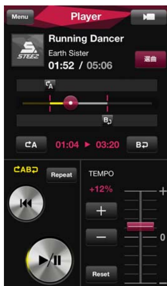
【ダンス機能进行操作するプレイヤー画面】