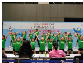
キッズ部門優勝 グリーンHOP(江戸川区)