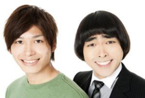
＜お笑いタレント＞ ヒカリゴケ