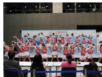
一般部門優勝 SHCフェアリーズ(調布市)