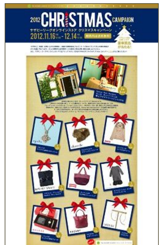
キャンペーンページ(イメージ)