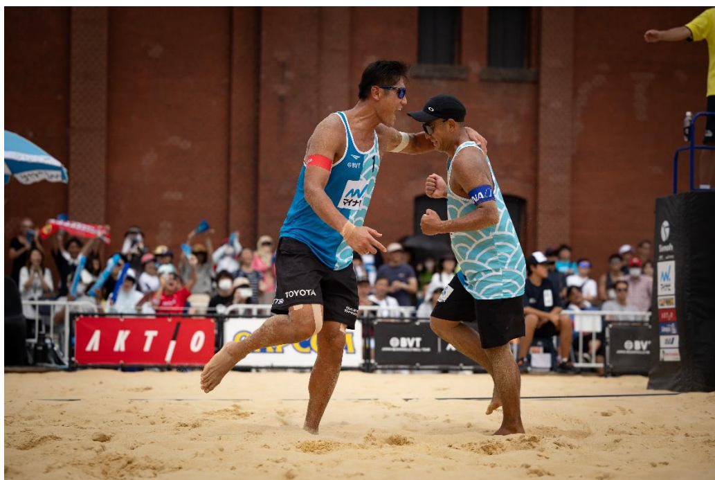
過去の大会の様子