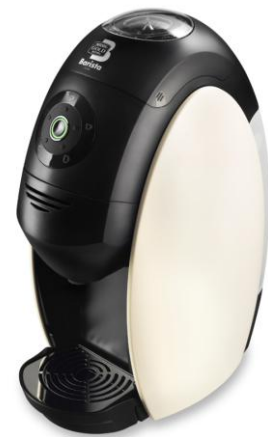
画像(上):「ネスカフェ ゴールドブレンド バリスタ」