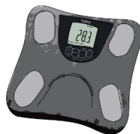
6. 体重成計 BC-763 (ストーンブラック)